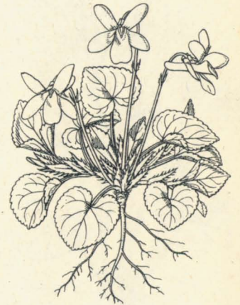
第 933 圖