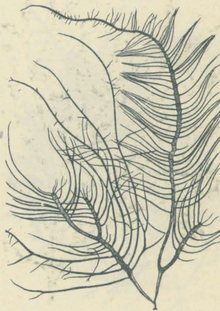
第 3127 圖

體ハ外形甚ダシク變化スレドモ模範的ナルモノハ扁平線狀ニシテ高サ 20-30cm、幅 2-3mm 許ニシテ中軸ノ兩縁ヨリ羽狀ノ小枝ヲ密ニ發ス。小枝ハ廣開シ、多クハ單條ナルレドモ再ビ分岐スルコトアリ。又小枝ハ基部附近並ニ中軸ノ先端附近ニハ之ヲ缺ク。紫紅色ニシテ柔軟稍粘滑ナリ。各地ニ普ク、干滿線間ニ生ズ。枝ノ基部縊レ、老成後體ノ基部中空ト成ルモノアリ、之ヲうづろむかで ( f. porracea Okam. ) ト稱ス。又本種ニ酷似スルモノニシテ體ノ幅少シク本種ヨリモ廣ク且ツ枝ノ基部縊レ、 G. prolongata J. Ag. ト稱スルモノアリ、然レドモ此ノ兩者ハ屢々殆ド區別困難ナリ。