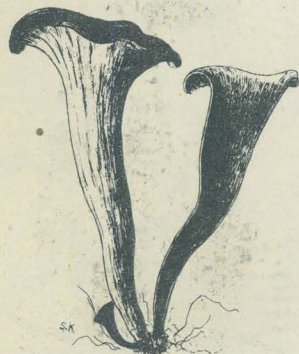
第 3089 圖