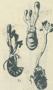
第 3092 圖