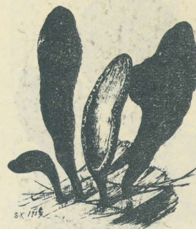
第 3091 圖