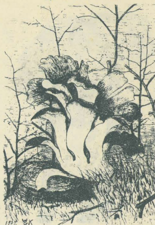
第 3078 圖

くり・なら其他ノ朽木ニ生ズ。分歧セル多數ノ扁平ナル茸體相重疊ス。表面灰白色又ハ闇褐色ニシテ、裏面ハ白ク、淺キ細孔ヲ密布ス。今昔物語ニ京都ノ北山ニテ茸ヲ喰ヒタル者踊リ舞ヒタリト記セルハ、まひたけニ非ズシテ恐ラク笑茸ナリシナルベシ。本菌ノまひたけノ名ハ其形態ヨリ出ヅ。美味ナル食用菌ナリ。其色ニヨリテくろまひトしろまひトニ區別ス。