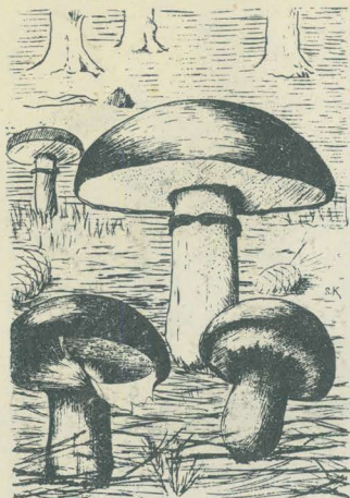
第 3075 圖